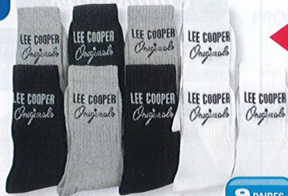
Ref. 589 Chaussettes Tennis Lee Cooper Composition : 69% coton - 28% polyester - 2% polyamide 1% élasthanne - 2 tailles : T1 (39/42) - T2 (43/46)