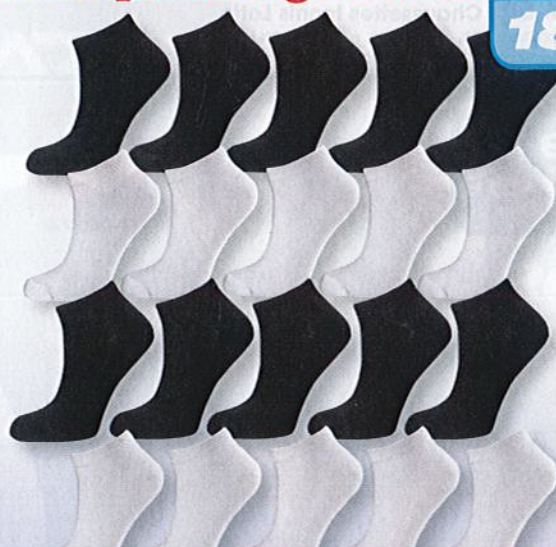
Ref. 501 (10 noires + 10 blanches) Chaussettes tige courte Composition : 98% polyester - 2% élasthanne 2 tailles : T1 (39/42) - T2 (43/46)