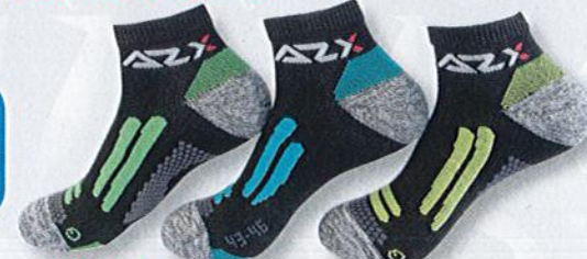
Ref. 317 Chaussette tige courte AZX

Composition : 46% polyamide - 20% Dryarn - 21% coton - 11% polyester - 2% élasthanne - 2 tailles : T1 (39/42) - T2 (43/46)