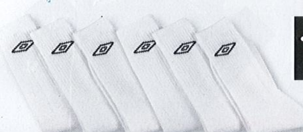
Ref. 542 (6 blanches) Chaussettes tennis Umbro