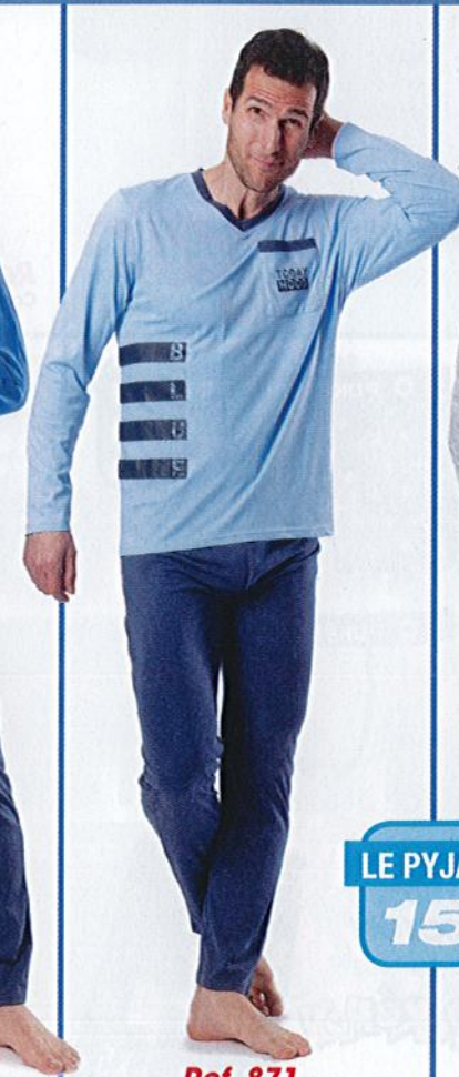
Ref. 871 Pyjama Blue