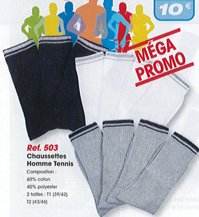
Ref. 503 Chaussettes Homme Tennis Composition : 60% coton 40% polyester 2 tailles : T1 (39/42) T2 (43/46)