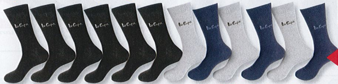
Ref. 500 (6 noires + 3 marines + 3 grises) Chaussettes Lee Cooper Composition : 75% polyester - 21% coton - 2% viscose - 2% élasthanne - 2 tailles : T1 (39/42) - T2 (43/46)

Tige de maintien élastiquée large et doublée pour un meilleur confort.