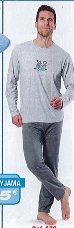
Ref. 872 Pyjama Team

Composition : 60% coton jersey - 40% polyester - 4 tailles : T2 (M) - T3 (L) - T4 (XL) - T5 (XXL)