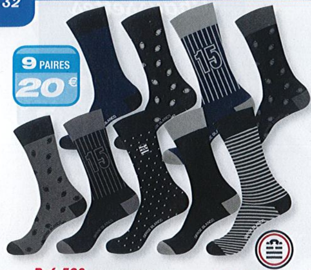
Ref. 528 Chaussettes Serge Blanco

Composition : 78% coton - 21% polyester - 1% élasthanne 2 tailles : T1 (39/42) - T2 (43/46)