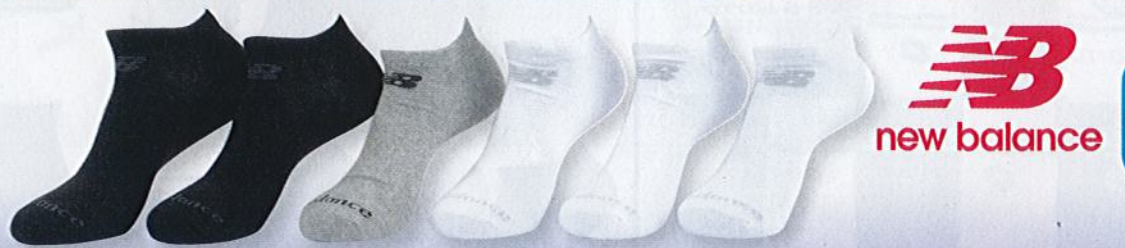
Ref. 532 Chaussettes tige courte New Balance Composition : 61% coton - 34% polyester - 5% élasthanne - 2 tailles : T1 (39/42) - T2 (43/46)