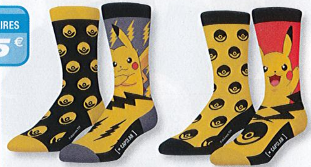
Ref. 560 Chaussettes Capslab Pokemon

Composition : 70% coton - 28% polyamide - 2% élasthanne 2 tailles : T1 (39/42) - T2 (43/46)