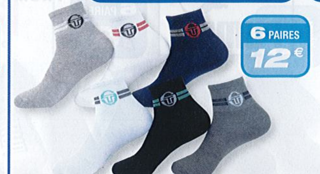
Ref. 531 Chaussettes tige 3/4 Sergio Tacchini

Composition : 60% coton - 37% polyester - 2% élastodienne - 1% élasthanne - 2 tailles : T1 (39/42) - T2 (43/46)