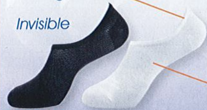
Ref. 582 Protège pieds Lee Cooper Composition : 96% polyester - 4% élasthanne - Taille unique : 40/46