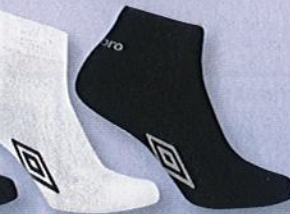
Ref. 524 (3 noires + 3 blanches) Chaussettes tige 3/4 Umbro

Composition : 58% coton - 40% polyester - 2% élasthanne 2 tailles : T1 (39/42) - T2 (43/46)