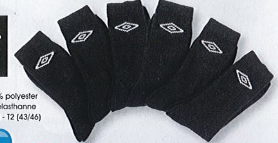
Ref. 541 (6 noires) Chaussettes tennis Umbro