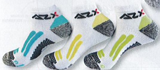
Ref. 318 Chaussette tige courte AZX

Microfibre thermorégulante, fine et ultra légère