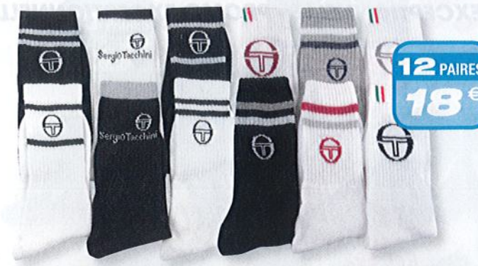
Ref. 539 Chaussettes Tennis Sergio Tacchini

Composition : 46% polyamide - 20% Dryarn - 21% coton - 11% polyester - 2% élasthanne - 2 tailles : T1 (39/42) - T2 (43/46)