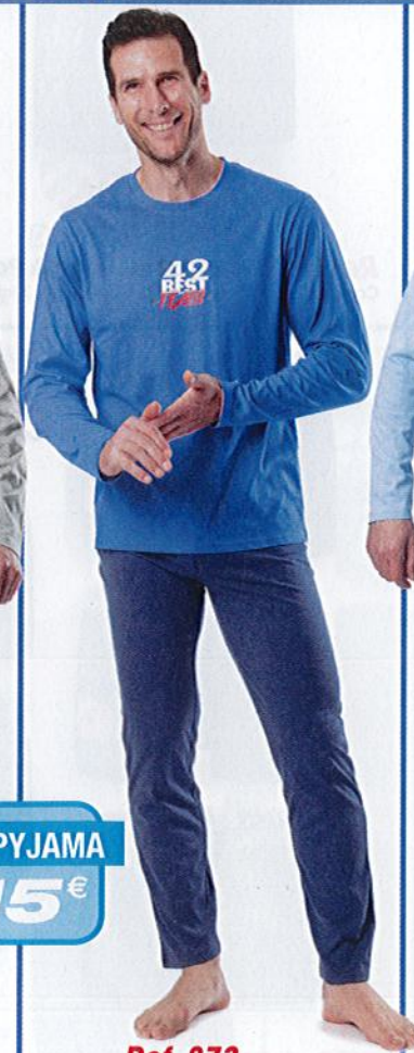
Ref. 873 Pyjama Best