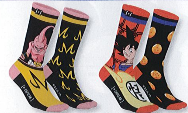
Ref. 559 Chaussettes Capslab Dragon Ball Z

Composition : 58% acrylique - 22% laine - 18% polyamide - 2% élasthanne 2 tailles : T1 (39/42) - T2 (43/46)