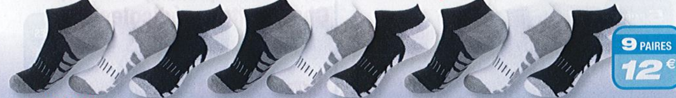
Ref. 525 Chaussettes tige courte

Semelle entièrement bouclette. Bande de resserrage pour un meilleur maintien.