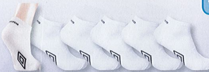
Ref. 544 (6 blanches) Chaussettes tige courte Umbro

Composition : 58% coton - 40% polyester - 2% élasthanne 2 tailles : T1 (39/42) - T2 (43/46)