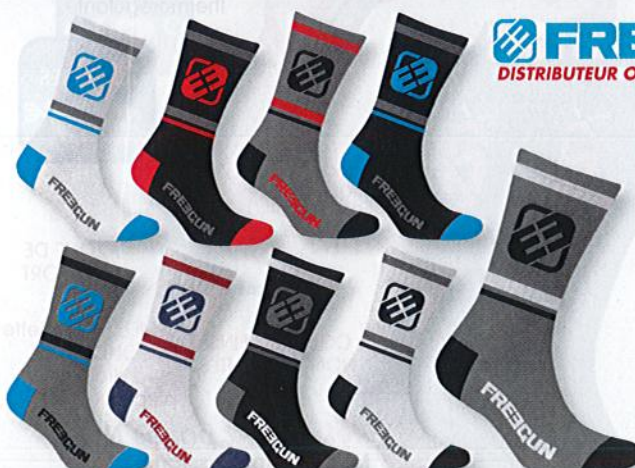
Ref. 566 Chaussettes tennis Freegun

Composition : 68% coton - 29% polyester - 3% élasthanne 2 tailles : T1 (39/42) - T2 (43/46)